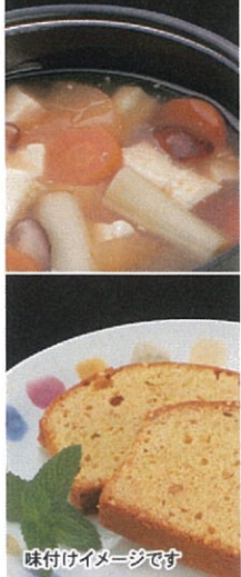
味付けイメージです

この商品は、独立行政法人国立病院機構・独立行政法人国立高度専門研究センターの管理栄養士が参加している 一般社団法人日本発芽玄米協会「日本の食と疾病予防研究会」の監修のもと商品化されたものです。